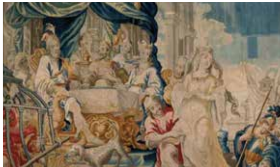
Tapisserie flamande de la fin du XVII e siècle « Bajazet, prisonnier de Tamerlan » Salon d'Honneur de l'Hôtel Consulaire.