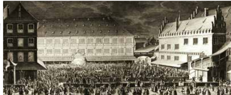
Vue du Neubau et de la Pfalz en date du 5 octobre 1744.

Le lendemain, le bruit court que le Magistrat serait revenu sur sa décision. La foule saccage entièrement le Neubau. Le Magistrat quitte alors l'édifice qui est, quelques années plus tard loué et vendu, en 1795, à des particuliers.