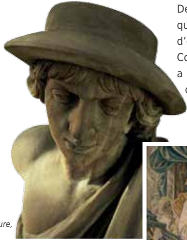
Buste de la façade représentant Mercure, dieu du commerce

Depuis les représentants des corporations, qui tenaient tête au Magistrat, aux chefs d'entreprises, élus de la Chambre de Commerce et d'Industrie, le Neubau a toujours abrité les indispensables débats nécessaires au développement économique de Strasbourg et de sa région.