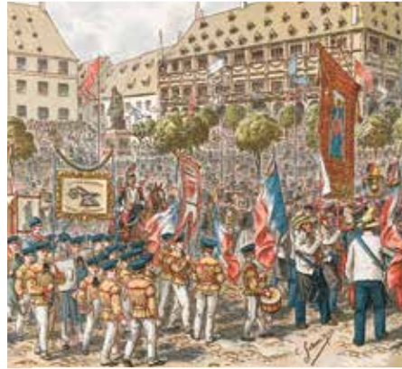
Les Fêtes de Gutenberg, le cortège industriel du 25 juin 1840. Collection Bibliothèque Alsatique du Crédit Mutuel.