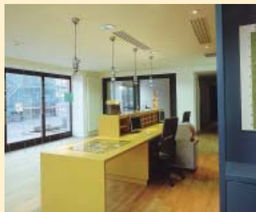
► OFFICE DU TOURISME

La maison est située au 114, Grand'Rue à Schirmeck.