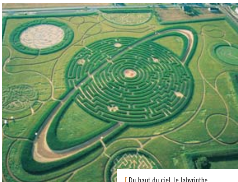
[ Du haut du ciel, le labyrinthe à la géométrie parfaite ]

Sur un calendrier dessinant la course des étoiles vagabondes, le visiteur découvre son signe et l'élément qui lui est associé, avant de s'engager dans le labyrinthe par la porte de l'air, de l'eau, de la terre ou du feu. Muni d'un livre des sorts, dans lequel il inscrit les indices qui lui permettront de franchir les grilles secrètes ou le bestiaire fantastique... Au bout du chemin, quatre jardins de sorcières mettent en scène une collection impres-