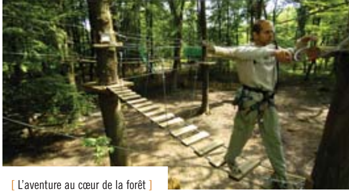
[ L'aventure au cœur de la forêt ]

P our ceux qui n'ont pas envie de faire des kilomètres en voiture pour accéder aux parcs aventures des Vosges (Alsace Aventure nature à Breitenbach ou Bol d'Air Aventure à La Bresse), le Naturaparc d'Ostwald. Parcours spécifique pour les 4-7 ans, parcours évolutifs pour les plus grands, les possibilités de passer d'arbre en arbre sont vastes : pont népalais, filet à grimper, passerelles suspendues, lianes, tyroliennes. Avant l'ouverture du Parc, en avril, des écoliers d'une école strasbourgeoise ont eu le plaisir de s'initier à l'aventure. Casqués et armés de baudriers, ils se sont familiarisés avec le matériel, ont