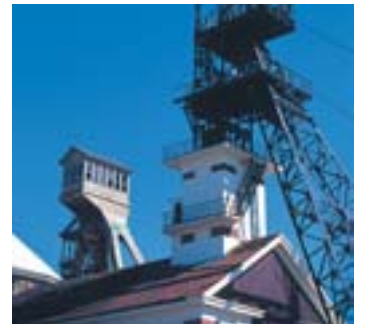
[ Le nouveau musée ]

3 janvier au 5 février (période de fermeture de l'hôtel). <